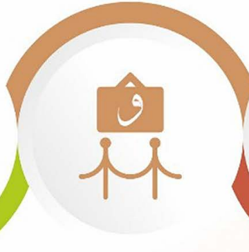
Görsel Sanatlar Sergisi