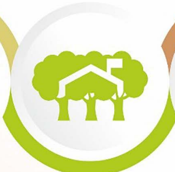
Yeşil Çevre Temiz Okul