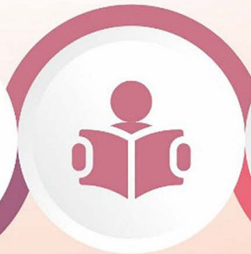
Okuyan 7' ler