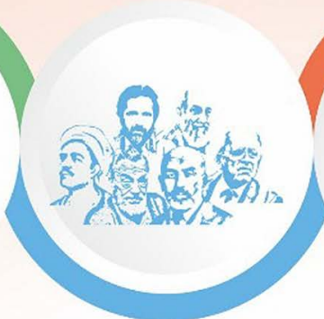
Kırk Şair 40 Şiir