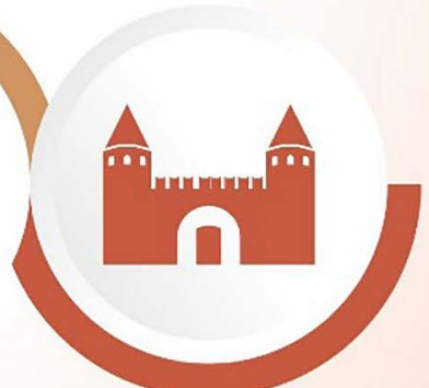
Müze İle Eğitim