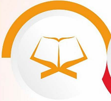
Kur'an-ı Kerim'i Güzel Okuma Yarışması