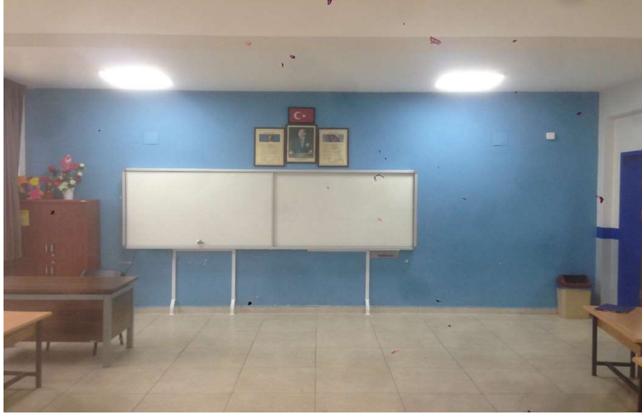
Resim-1: Hatalı Kurulum.